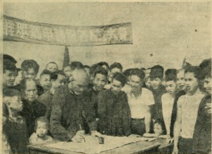
Китайская Народная Республика. Китайский народ борется за социалистическое переустройство деревни. Число производственных сельскохозяйственных кооперативов достигло около одного миллиона четырехсот тысяч. Создание новых кооперативов носит массовый характер. НА СНИМКЕ: в провинции Гуандун, крестьяне деревни Чжунчун Хайан записываются в производственный сельскохозяйственный кооператив.

Американцы продолжают нарушать нейтралитет Австрии КОЛОНИЗАТОРЫ СТРЕМЯТСЯ СОХРАНИТЬ СВОЕ ГОСПОДСТВО В МАЛАЙЕ