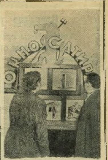
В клубе нефтеперерабатывающего завода выпускается «Огню сатиры». В нем помещаются меткие карикатуры на бракоделов, прогульщиков, лодырей.

«Огню сатиры» пользуется большой популярностью среди нефтяников.