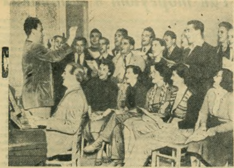
Чехословацкая Республика. Клуб завода имени Яна Швермы в городе Брно — одно из лучших культурных учреждений в Словакии. В клубе имеется много кружков художественной самодеятельности — ансамбль песни и пляски, оркестр, драматический коллектив, студия изобразительных искусств, кружок фотолюбителей, литературный кружок и другие.

Хоровой кружок охотно пополняет свой репертуар народными песнями. Некоторые песни члены кружка записали в горных деревнях родного края.