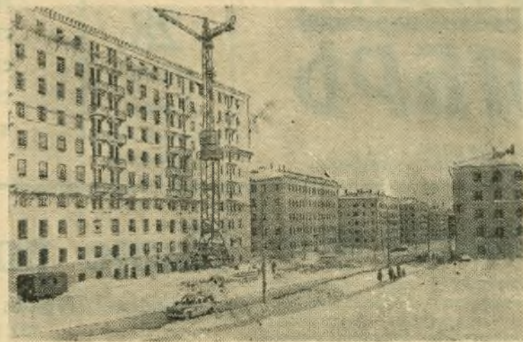
Москва сегодня. Строительство жилых домов на 5-й Черемушкинской улице.