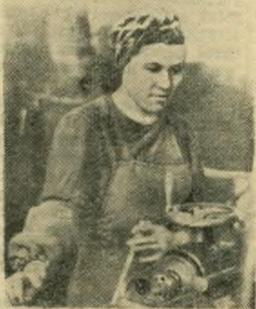
НА УРОВНЕ САМОГО ВЫСОКОПРОИЗВОДИТЕЛЬНОГО ЧАСА

В эти дни в штамповочном цехе изучается проект Директив XX съезда КПСС по шестому пятилетнему плану. Горячо одобряя величественную программу коммунистического строительства в нашей стране, рабочие берут на себя повышенные обязательства, чтобы день открытия съезда встретить высокими трудовыми показателями.