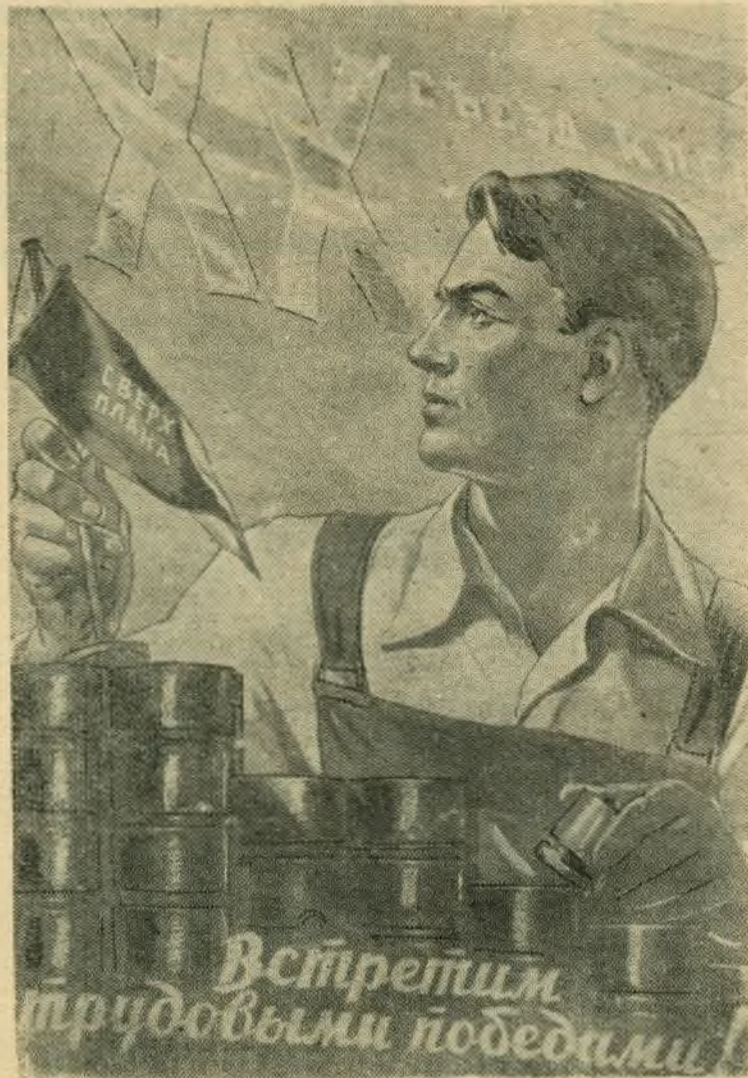
Плакат работы художника В. Корецкого.

Сейчас на заводе разрабатывается техническая документация: чертежи, технология, приступлено к изготовлению оснастки.