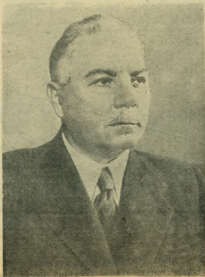
Тов. К. Е. ВОРОШИЛОВ.

Сейчас в 24 пролете водосливной плотины, где будет установлен уникальный агрегат, уже залит бетоном два первых блока. (ТАСС).