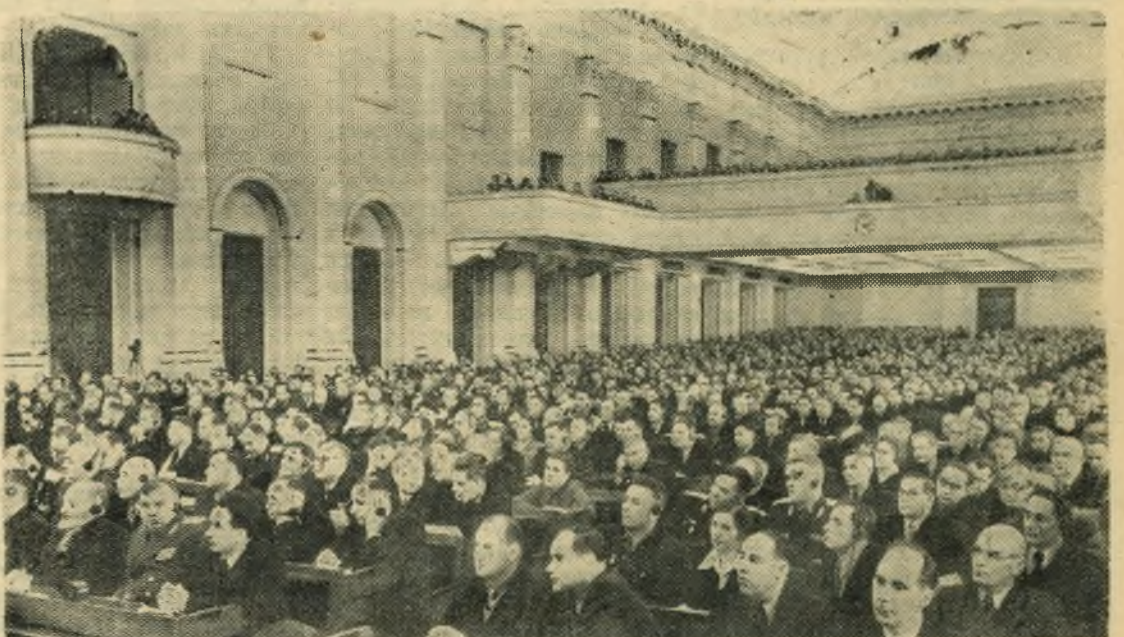
XX съезд Коммунистической партии Советского Союза. НА СНИМКЕ: в зале заседаний.