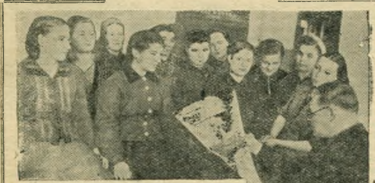
Рабочие, инженерно-технические работники и служащие кожевенного завода «Шеврохром» с огромным удовлетворением встретили отчетный доклад Центрального Комитета КПСС XX съезду партии. Они принимают на себя обязательства по досрочному выполнению плана шестой пятилетки.

XX съезд КПСС вызвал мощный подъем трудовой и политической активности трудящихся Сызрани