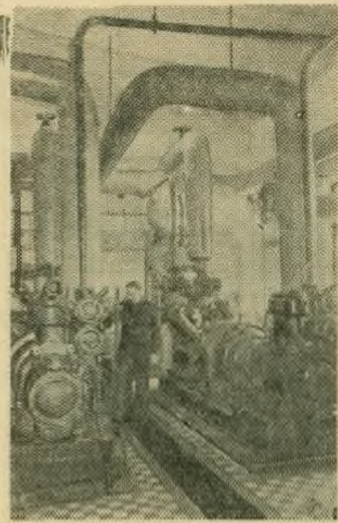
Эстонская ССР. В Пярну строится самый мощный в республике рыбоконсервный комбинат. В его цехах устанавливаются поточные линии, автоматические прессы, холодильные аппараты и другое оборудование. Введен в эксплуатацию колдильник и цех по изготовлению консервов из салаки. На снимке: компрессорный зал колдильника.