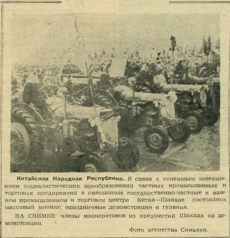
Китайская Народная Республика. В связи с успешным завершением социалистических преобразований частных промышленных и торговых предприятий в смешанные государственно-частные в важном промышленном и торговом центре Китая—Шанхае состоялся массовый митинг, праздничные демонстрации и гулянья.

НА СНИМКЕ: члены кооперативов из предместий Шанхая на демонстрации.