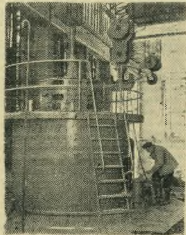
Грузинская ССР. В шестой пятилетке вводится в действие ряд гидроэлектростанций. Среди них Гуматская ГЭС.

НА СНИМКЕ: монтаж первого агрегата.