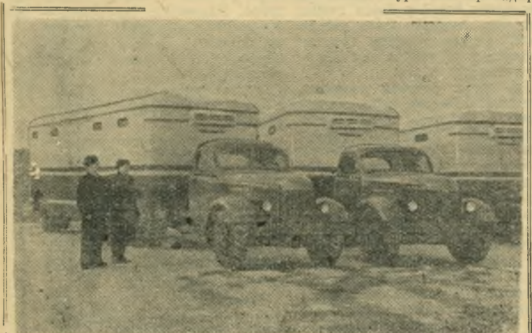
Украинская ССР. Днепропетровский авторемонтный завод выпустил герметически закрывающиеся автофургоны, которые являются полуприцепами к тягачам «ЗИС-151». Они предназначены для перевозки продовольственных и других товаров. Автофургоны очень удобны для транспортировки ценных грузов на дальние расстояния. Грузоподъемность каждой машины 7 тонн. НА СНИМКЕ: готовые автофургоны.

Метод деления глубины резания и подачи использован при создании многолезвийных станков. При многолезвийной работе в процессе обработки детали могут участвовать одновременно 15—20 резцов. Несмотря на то, что некоторые из этих резцов снимают стружку малого сечения, общее сечение стружки получается значительным. В результате этого многолезвийный метод может в 5—10 раз повысить производи-