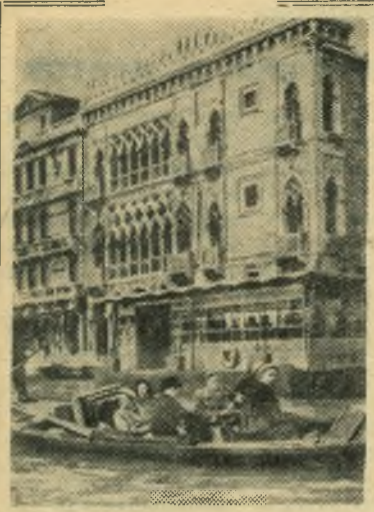
Италия. Группа советских туристов совершает прогулку на гондолах по каналам Венеции.