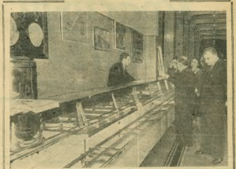
Москва. В нынешнем году демонстрационный зал Центральной научно-исследовательской лаборатории Главного управления торгового оборудования Министерства торговли СССР пополнится новыми экспонатами — машинами и оборудованием для предприятий и торговых организаций.