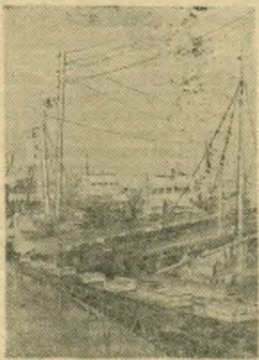
Махачкала. Ежедневно в порт прибывают суда, груженные рыбой для дальнейшей обработки ее на предприятиях Дагестана.

НА СНИМКЕ: в порту во время выгрузки улова рыбы с судов. Фото М. Редькина. (Фотохроника ТАСС).