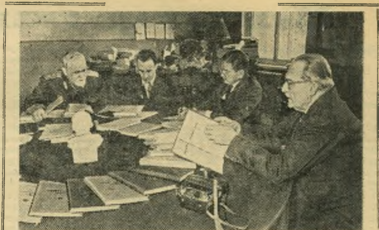
Пребывание в Ленинграде группы ученых-медиков США. Гости знакомятся с деятельностью крупнейших научных учреждений города. НА СНИМКЕ: гости на приеме у директора Зоологического института Академии наук СССР академика Е. Н. Павловского (слева).