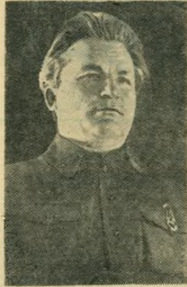
Сергей Миронович КИРОВ.

По выходе из тюрьмы Сергей Миронович переезжает в Иркутск, а затем во Владикавказ. Здесь, работая сотрудником газеты «Терек», он вместе с тем развертывает большую партийную работу. Вскоре его арестовывают и направляют в Иркутск на суд по делу об организованной им в 1906 году подпольной типографии. Кирову удается вырваться из лап царского суда и он снова направляется во Владикавказ.