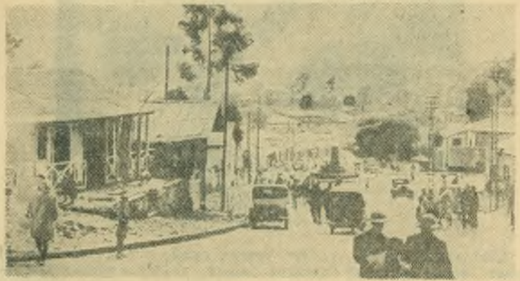
Аддис-Абеба — столица Эфиопии. Одна из улиц.

БЛАНК ТРЕБУЕТ СОЗДАНИЯ ПОЛУМИЛЛИОННОЙ АРМИИ