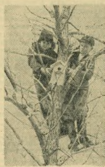
НА СНИМКЕ: в первый день каникул. Установка скворечниц в пионерском парке.