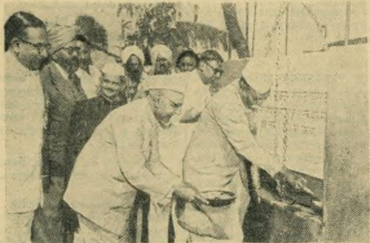
Индия. В штате Бихар началось строительство нового моста через одну из крупнейших рек Азии — Ганг. Этот мост свяжет северную и южную части Бихара. Он будет иметь большое хозяйственное значение для этого района.

НА СНИМКЕ: президент республики Индии Раджендра Прасад закладывает первый камень на строительстве моста.