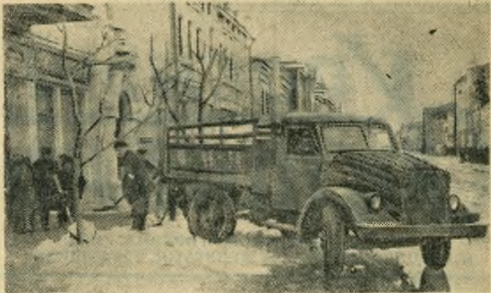
Началась весенняя очистка города. НА СНИМКЕ: вывозка льда и снега с Советской улицы.