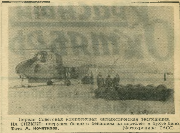
Первая Советская комплексная антарктическая экспедиция. НА СНИМКЕ: погрузка бочек с бензином на вертолет в бухте Дено.