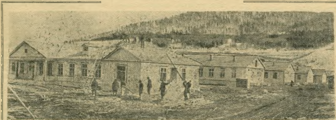
Красноярский край. В районах строительства Красноярской ГЭС создаются крупные рабочие поселки. Только на правом берегу Енисея будет построено 200 тысяч квадратных метров жилой площади. Свыше 5 тысяч квадратных метров жилья вступит в эксплуатацию в этом году.

НА СНИМКЕ: строительство жилого поселка в Лалетино.