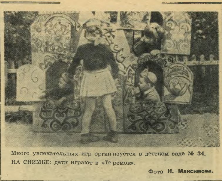
Много увлекательных игр организуется в детском саду № 34. НА СНИМКЕ: дети играют в «Те ремю».