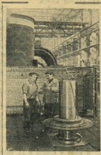
Свердловск. С опережением графика работает завод «Урал-электроаппарат». План четырех месяцев он перевыполнил. В мае уральские электромашиностроители изготовили несколько агрегатов для крупных строек страны.