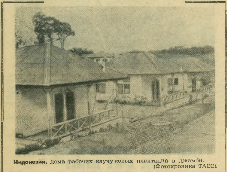
Индонезия. Дома рабочих каучуковых плантаций в Джамби.