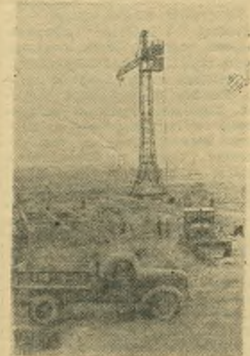
Азербайджанская ССР. В окрестностях Кировабада ведется строительство глиноземного завода. Он будет снабжать сырьем Сумгайтский алюминиевый завод.

НА СНИМКЕ: строительная площадка цеха железобетонных изделий.