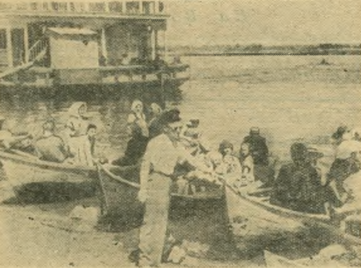
Волга — чудесное место отдыха трудящихся. Многие имеют собственные лодки. Хорошо после окончания трудового дня прокатиться на лодке по широкой волжской глади, съездить на рыбалку.

Ваш Ник. Атаров». Учащиеся решили установить регулярную переписку с писателем.