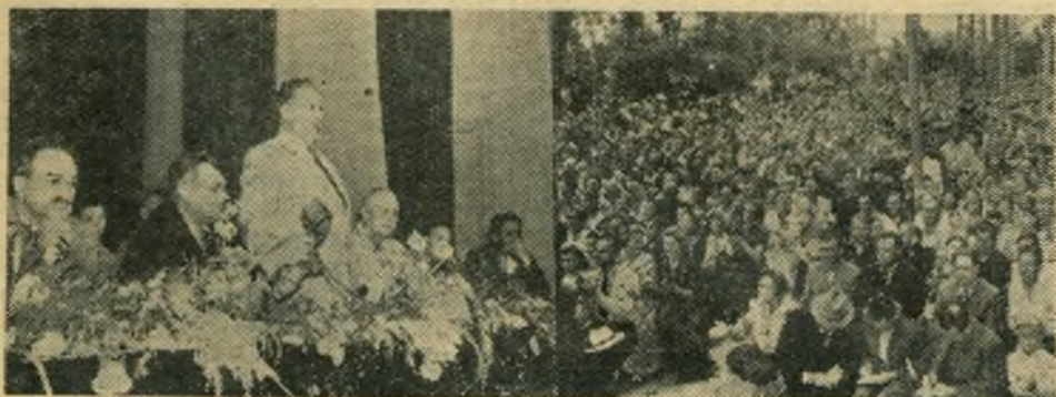
НА СНИМКЕ: на митинге в Зеленом театре колхоза имени Сталина в станции Григориполисской Ново-Александровского района Ставропольского края. Выступает товарищ И. Броз Тито.

Советское правительство передало также в качестве подарка Президенту ФНРЮ товарищу Иосипу Броз Тито пассажирский самолет ИЛ-14.