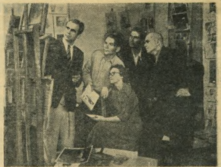
Одесса. Областной Дом народного творчества поддерживает постоянную связь с самостоятельными художниками сельских клубов. Для них организованы семинары по живописи и рисунку, консультации.