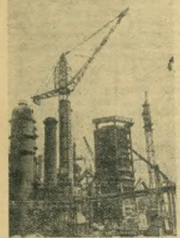
Сталинская область. Трест «Сталинметаллургстрой» сооружает на Сталинском металлургическом заводе мощную доменную печь. Коллектив обязался досрочно закончить строительство печи.

Живая связь с массами предполагает личное участие партийных и советских руководителей в массово-политической работе. Они призваны быть страстными пропагандистами и агитаторами. Большое значение в жизни пред-