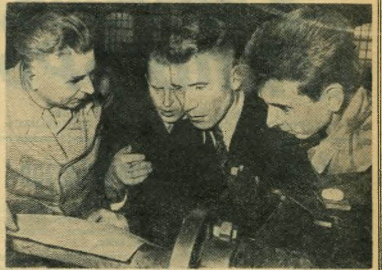
Недавно советская профсоюзная делегация по обмену опытом производственной и профсоюзной работы совершила поездку по Германской Демократической Республике.

Особое внимание уделяется значительному улучшению качества и ассортимента, в частности, внешней отделке товаров, выпуску изделий разнообразных моделей и фасонов. В широких масштабах