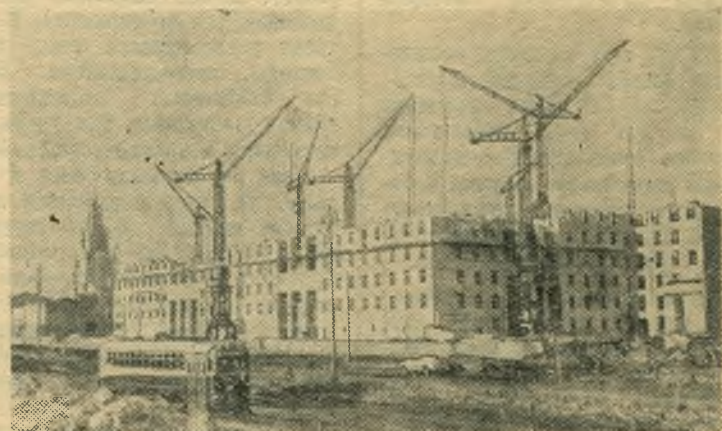
Москва. На Ленинских горах со здается новый юго-западный район столицы.

На заводе освоено производство кожухов барабана для кукурузоуборочных комбайнов, которые в текущем году будут изготавливаться гидротурбинным заводом. На сегодняшний день изготовлено 150 узлов. На заводе изготовлено шесть автобусов, которые готовятся к отправке нефтяникам Сахалина.