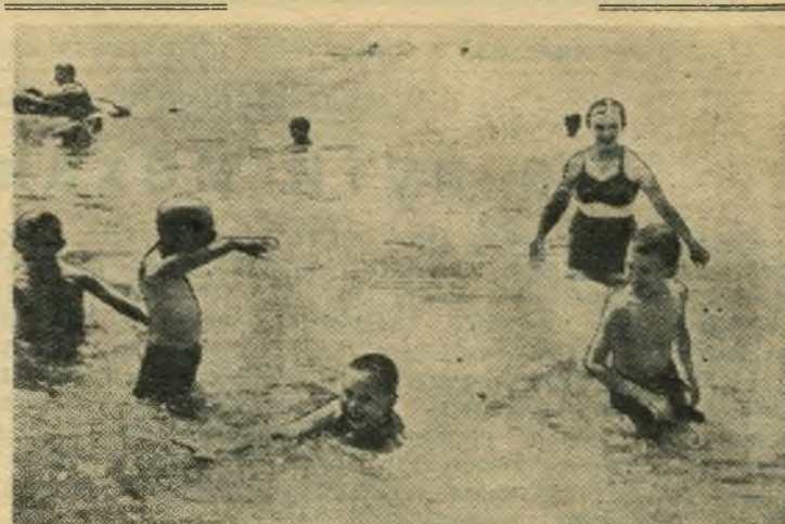
Озеро — любимое место пионеров, отдыхающих в лагере для детей гидротурбиностроителей в селе Балашейка. Ребята готовы бултыхаться в воде целыми днями. Но лагерная жизнь построена по строгому распорядку. Всему свое время. Поэтому с особым наслаждением купаются дети тогда, когда это разрешается, под присмотром пионервожатых. Но все равно — очень хорошо!