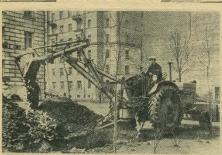
Ленинград. При работе на дворовых и других небольших территориях успешно применяются землеройные машины «Э-153». выпущенные киевским заводом «Красный экскаватор». На базе колесного трактора «Беларусь» смонтирована стрела с ковшем емкостью в 0,15 кубического метра и грейсер. Все рабочие рычаги и опоры для закрепления машины приводятся в действие с помощью гидравлических насосов. Новой машиной можно рыть траншеи и производить их засыпку, укладывать трубы, использовать механизмы как бульдозер и кран.

Книги имеются в продаже в магазинах и киосках Книготорга.