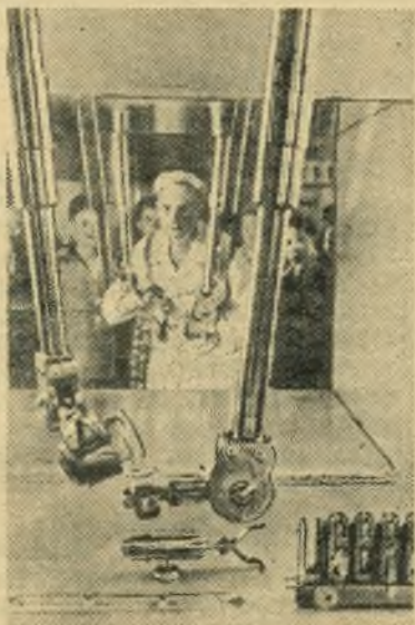
Москва. На Всесоюзной промышленной выставке павильон «Атомная энергия в мирных целях» привлекает всеобщее внимание. В нем экспонируется богатейшая коллекция урановых руд, запасы которой в земной коре колоссальны — около 200 триллионов тонн.

В реакторном зале посетители наблюдают голубоватое свечение в активной зоне действующего атомного реактора мощностью до 200 киловатт.