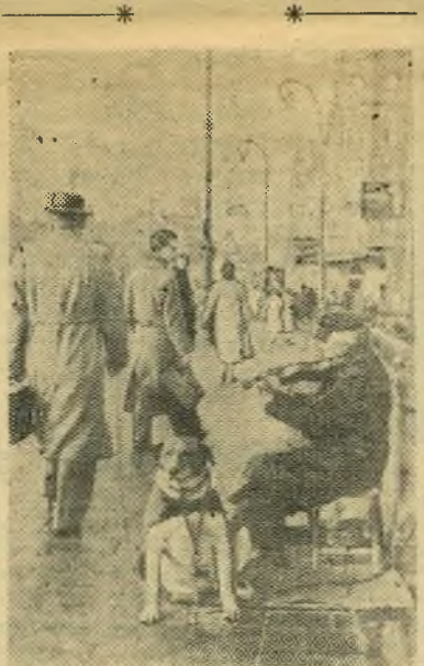
Голландия. Амстердам. Уличный музыкант.

КАРАЧИ, 8 июля. (ТАСС). В порт Карачи прибыл советский пароход «Иван Ползунов» — третий пароход, доставивший из СССР груз пшеницы в виде дара народу Восточного Пакистана, пострадавшему от стихийных бедствий.