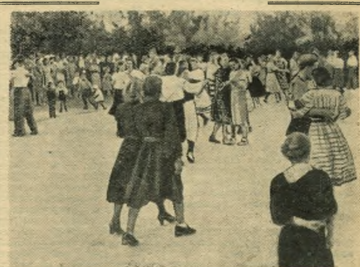
Излюбленным местом отдыха жителей поселка Заводской стал молодой парк нефтеперерабатывающего завода. Здесь и услугам отдыхающих ларьки с мороженым, газированной водой, буфеты. Участники художественной самодеятельности заводского клуба часто выступают с концертами, организуются танцы.