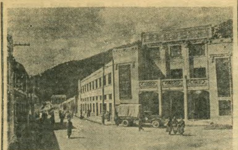
Китайская Народная Республика. Молодой город Шуанцзинь — административный центр Тибетского автономного округа Аба в провинции Сычуань.

НА СНИМКЕ: одна из городских улиц. Справа — здание Государственной национальной торговой компании.