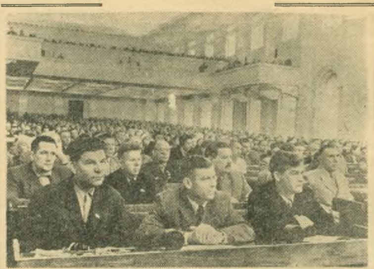
Москва. Пятая сессия Верховного Совета СССР четвертого созыва. НА СНИМКЕ: в зале заседаний.

Повестка дня пятой сессии Верховного Совета СССР исчерпана. Сессия объявляется закрытой. (ТАСС).