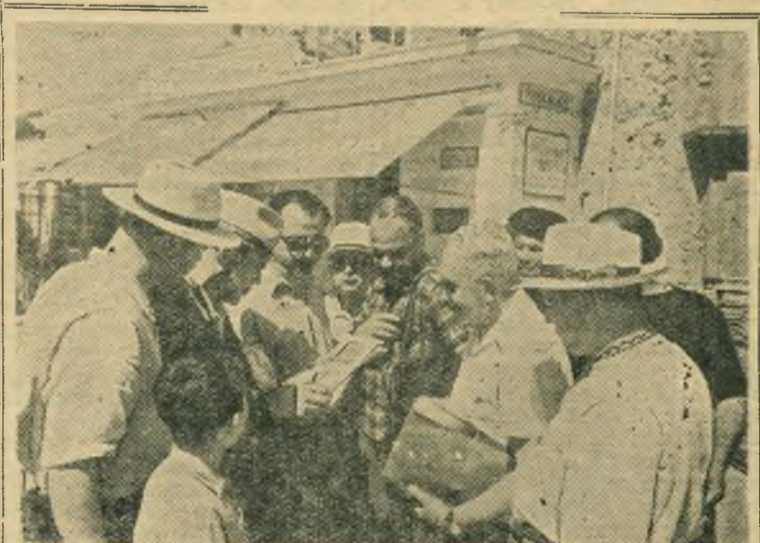
Недавно группа советских туристов совершила путешествие на теплоходе «Победа» вокруг Европы. В Италии советские туристы осмотрели города Неаполь, Помпею, Сорренто, Рим и остров Капри.

Неплохо было бы комбайностроителям поучиться в этом отношении у коллектива нефтеперерабатывающего завода, поселок которого стал за короткое время самым благоустроенным.