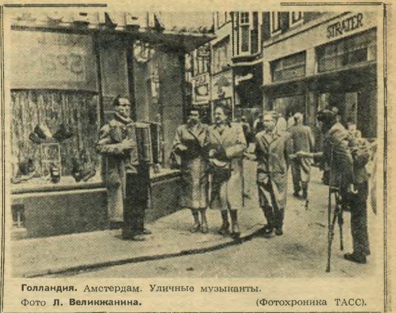
Голландия. Амстердам. Уличные музыканты.