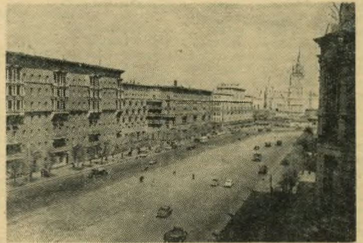
Москва сегодня. Можайское шоссе.

К Всесоюзному фестивалю советской молодежи в Измай-