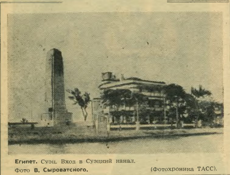
Египет. Суэц. Вход в Суэцкий канал.