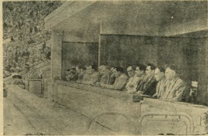
В день открытия Спартакиады народов СССР Москва, 5 августа на Центральном стадионе имени В. И. Ленина открылась Спартакиада народов СССР.

Город должен всемерно усиливать свою помощь труженикам сельского хозяйства в уборке урожая, в вывозке зерна на заготовительные пункты. Убрать урожай вовремя и без потерь — всенародная задача. Долг каждого коллектива предприятия — оказывать всемерную помощь сельскому хозяйству.