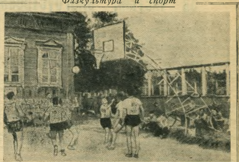
Областные соревнования по баскетболу. ИА СНИМКЕ: момент игры между баскетболистами Сызрань и Ставрополя.