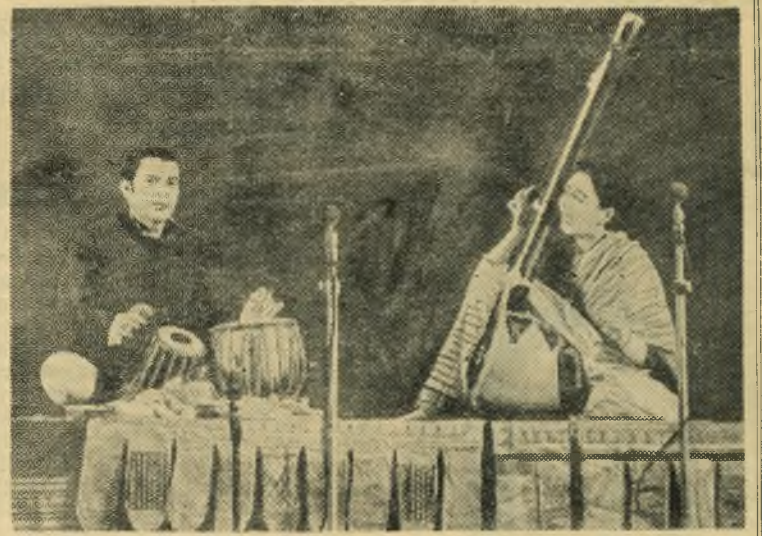
В Советском Союзе гостит группа индийских певцов, танцоров и музыкантов. После концертов в Москве и Ленинграде гости посетят среднеазиатские республики.

На строительство парикмахерской ассигновано 50 тысяч рублей.