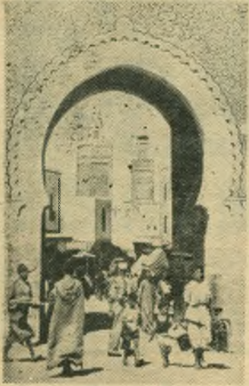
Марокко. В городе Фес.

„Аль-Гумхурия“: „Египет ни при каких обстоятельствах не потерпит каких-либо действий иностранных государств, ущемляющих его суверенитет“.