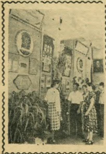
Алтайский край. В Барнауле открылась краевая сельскохозяйственная выставка. Алтай в этом году сдает государству 350 миллионов пудов зерна. Только целинный зерносовхоз «Комсомольский» сдаст не менее миллиона 250 тысяч пудов зерна.

НА СНИМКЕ: у стенда зерносовхоза «Комсомольский» на краевой сельскохозяйственной выставке.