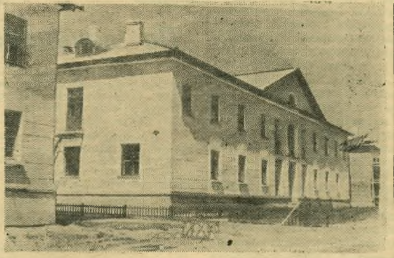
Строители строительного управления Сызранской ТЭЦ в честь праздника строителей слали в эксплуатацию новый дом — светлое благоустроенное общежитие. НА СНИМКЕ: новое общежитие.