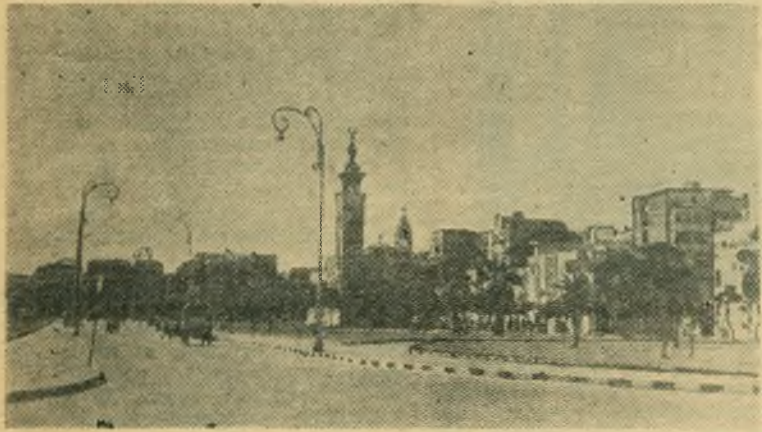
Египет. На улице Каира.