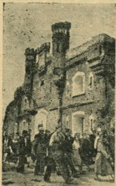
Брест. Трудящиеся города отметили 12-летие со дня освобождения Бреста от гитлеровских захватчиков и 15-летие обороны Брестской крепости. Советские люди свято чтут память тех, кто отдал жизнь за свободу и независимость Родины.

Дела важнее уборки урожая и заготовок овощей сейчас у нас нет.