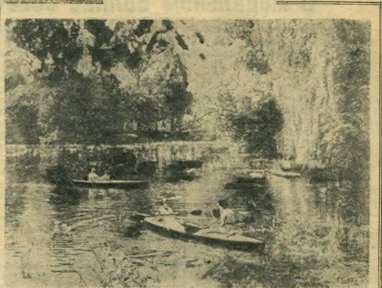
В Польской Народной Республике. Трудящиеся отправляются на время отпусков на курорты, в санатории и дома отдыха. НА СНИМКЕ: отдыхающие на прогулке по озеру близ Чеплиц.