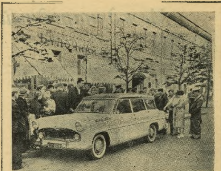
В Москву прибыла группа французских туристов — сотрудников журнала «Пари-матч», совершающих автомобильное путешествие по Советскому Союзу. После ознакомления с достопримечательностями столицы французские гости продолжают путешествие по стране. НА СНИМКЕ: машина французских гостей на улицах столицы.

концертами в красном уголке паровозного депо и перед железнодорожниками на станции «Правая Волга». С. Варламов.