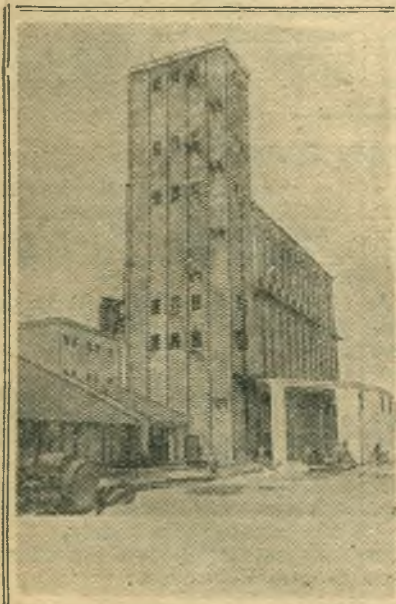
Эстонская ССР. Закончено строительство первой очереди Таллинского элеватора — крупнейшего в Эстонии. Он оснащен современными мощными зерноочистительными агрегатами. Имеется сушилка с пропускной способностью 8 тонн зерна в час и мельница, которая сможет производить помол 85 тонн зерна в сутки.

Картофельные поля колхозов и совхозов расширились в этом году почти на 25 процентов и занимают 90 тысяч гектаров. Повышение заготовительных цен сделало картофель высокодоходной отраслью колхозного производства. Сельхозартель «Большевик», Руднянского района, рассчитывает, например, получить полумиллионный доход от реализации картофеля. Передовые колхозы выполняют сейчас ранними сортами обязательные поставки, планируя продать затем дополнительно значительное количество картофеля по закупочным ценам.