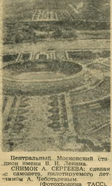
Центральный Московский стадион имени В. И. Ленина. СНИМОК А. СЕРГЕЕВА: сделан самолетом, пилотируемого летчиком А. Чеботаревым. (Фотохроника ТАСС.)

П. Малеткин. КРАСНЫЙ ОКТЯБРЬ Стр. 3. 28 августа 1956 г.