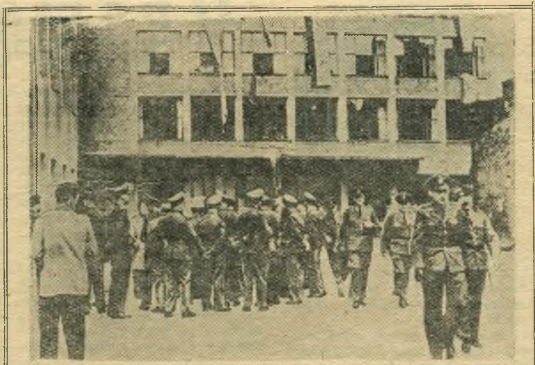
После вынесения решений судебных властей в Западной Германии о запрещении коммунистической партии в стране началась разгул полицейского террора. В городах Рурской области, в Гамбурге и Дюссельдорфе полицейские производили обыски в рабочих квартирах и нападали на редакции газет и служебные заведения КПГ. Многие члены компартии подверглись аресту. По всей Германии началось мощное народное движение протеста против террористических мероприятий боннских властей. НА СНИМКЕ: нападение полицейских на здание КПГ в Дюссельдорфе. В знак протеста коммунисты вывесили на окнах здания национальные флаги.