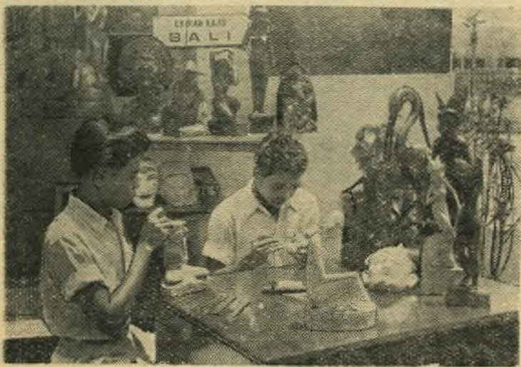
На острове Бали. Художники-резчики за изготовлением скульптур из дерева.

11 лет со дня образования Демократической Республики Вьетнам Лос не присоединяется к СЕАТО