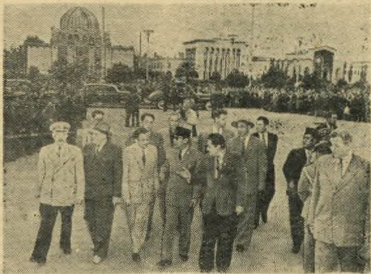
Москва. Президент Республики Индонезии Сукарно посетил Всесоюзные сельскохозяйственную и промышленную выставки. НА СНИМКЕ: Президент Сукарно и сопровождающие его лица на территории выставки.