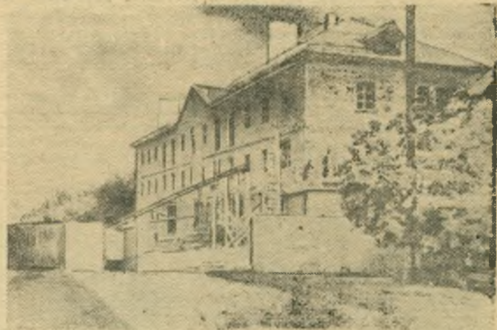
В городе строится много новых жилых домов. НА СНИМКЕ: строительство жилого дома на улице Карла Маркса. Строительство ведет строительномонтажное управление № 4. Строители взяли обязательство сдать дом в эксплуатацию в этом году.

В прошлом месяце комбинат отгрузил 33 дома нефтяникам Башкирии.