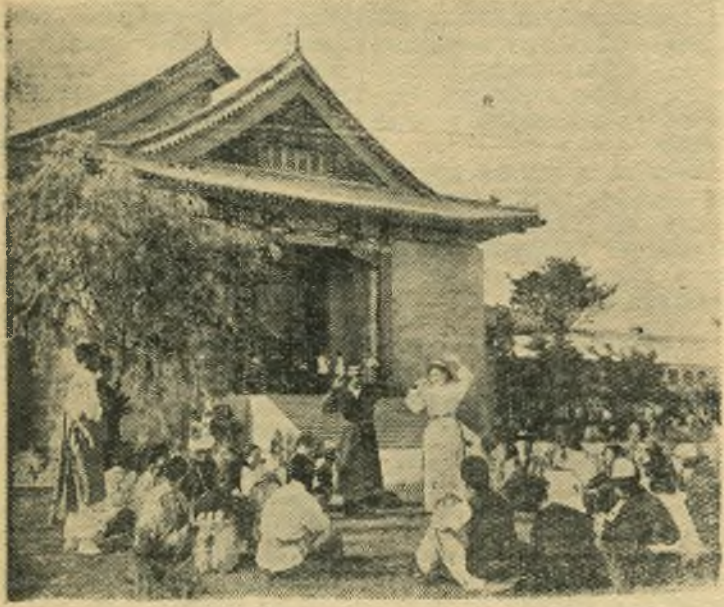
Китайская Народная Республика. За пять лет существования Центрального института национальных меньшинств в Пекине его окончили около семисот человек. В настоящее время в институте обучается более 1600 студентов — представители 52 национальных меньшинств Китая.

НА СНИМКЕ: в часы досуга.