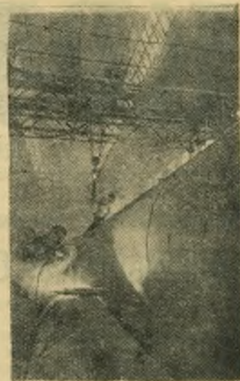
Румынская Народная Республика. В цехе бухарестского завода имени Мао Цзэ-дуна.

В заключение своего послания представители населения Тираны от имени всего албанского народа шлют братским советским народам пожелания дальнейшего успеха в построении коммунизма в своей стране, на счастье всех народов мира.