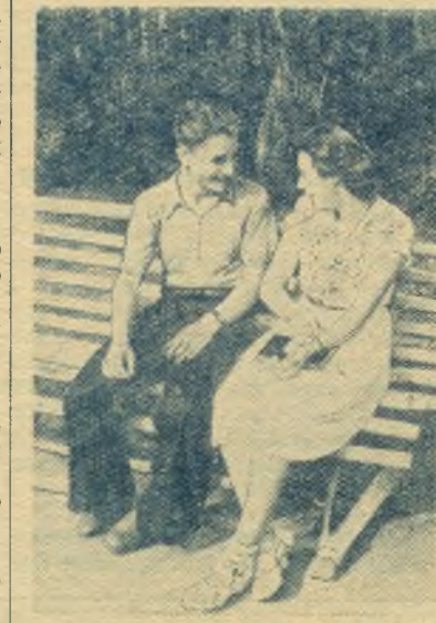
В парке имени Ленина.

КРАСНЫЙ ОКТЯБРЬ 3 стр. 9 сентября 1956 г.