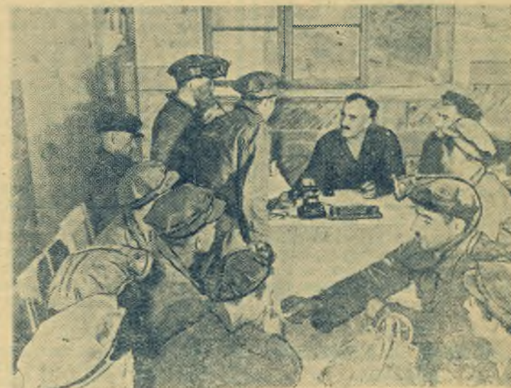
Грузинская ССР. Горняки Тисикульской шахты имени Ленина добились значительных производственных успехов. В июле они выдали сверх плана 3.042 тонны угля.

Коллектив второй смены 4-го участка обязался ежедневно перевыполнять сменные задания.