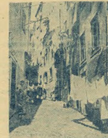
Португалия. На одной из улиц Лиссабона.