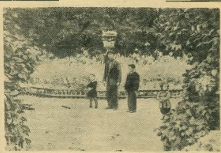
В городе создано немало зеленых уголков, где под сенью деревьев любят отдыхать трудящиеся. Одним из таких уголков стал сад имени Тимирязева.

НА СНИМКЕ: на центральной аллее сада.