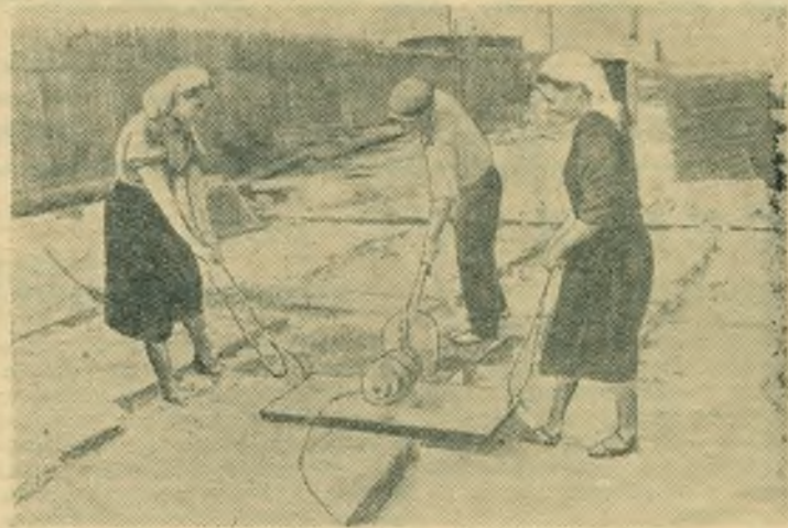
На растворном узле строительства завода кузнечно-прессового оборудования организовано изготовление железобетонных плит для перекрытий теплотрассы. Работу по их производству возглавила энергичная комсомолка Лидия Лизунова, окончившая недавно Куйбышевский строительный техникум.

В целях повышения безопасности населения взрывы были произведены, как и прежде, на большой высоте, в отдаленных от населенных пунктов районах.