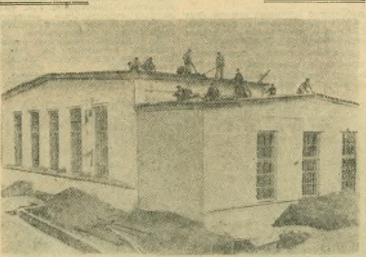
На поселке строителей завода кузнечно-прессового оборудования заканчивается сооружение котельной.

На снимке: бригада Валентина Дурасова под руководством мастера Евгения Погудалина заканчивает кровельные работы на котельной.