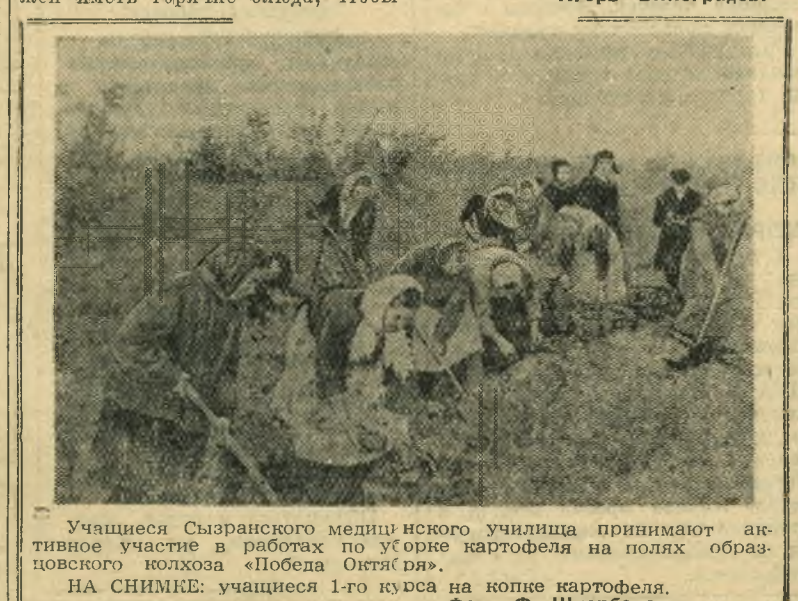
Учащиеся Сызранского медицинского училища принимают активное участие в работах по уборке картофеля на полях образцового колхоза «Победа Октября». НА СНИМКЕ: учащиеся 1-го курса на копке картофеля.