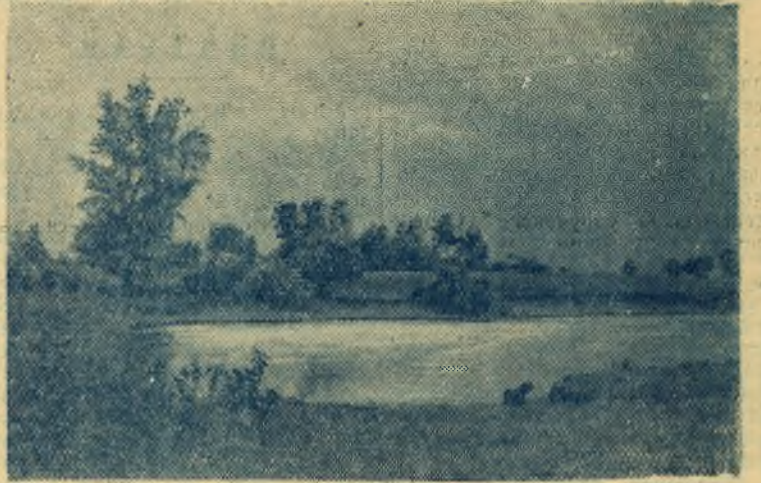
На озере «Зеркальном».