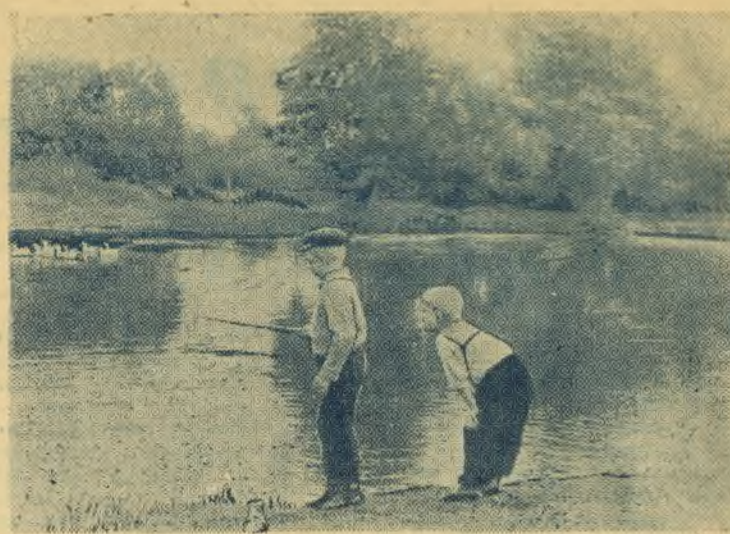
Юные рыболовы