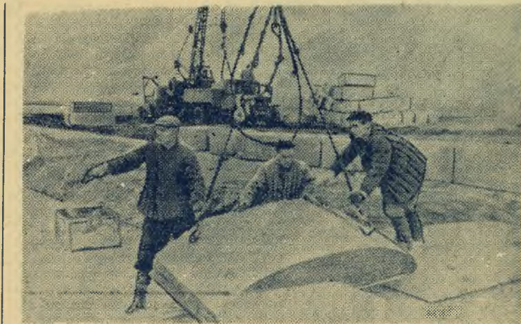
На строительной площадке поселка «Образцовский». НА СНИМКЕ: такелажники из бригады тов. Борового монтируют очередной блок фундамента.

Коллектив сотрудников школы взял на себя обязательство — своевременно подготовить здание школы и все необходимое к началу занятий. Ремонтные работы были закончены в установленный графиком срок, учебные классы и кабинеты оборудованы и пополнены новыми наглядными пособи-