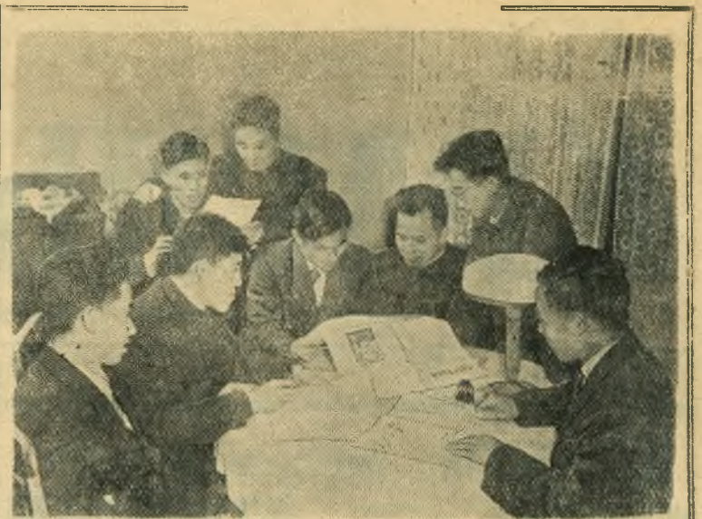
Харьков. Китайские практиканты, находящиеся на тракторном заводе имени Орджоникидзе, с большим воодушевлением изучают материалы VIII Всекитайского съезда Коммунистической партии Китая.