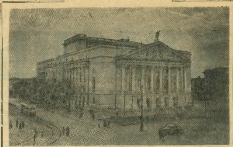
Казань. В центре города, на площади Свободы, воздвигнуто новое здание театра оперы и балета. Новый театр, носящий имя татарского поэта - патриота Героя Советского Союза Мусы Джалиля, открывает сезон премьерой оперы Н. Жиганова «Алтын чеч». НА СНИМКЕ: здание нового театра оперы и балета.