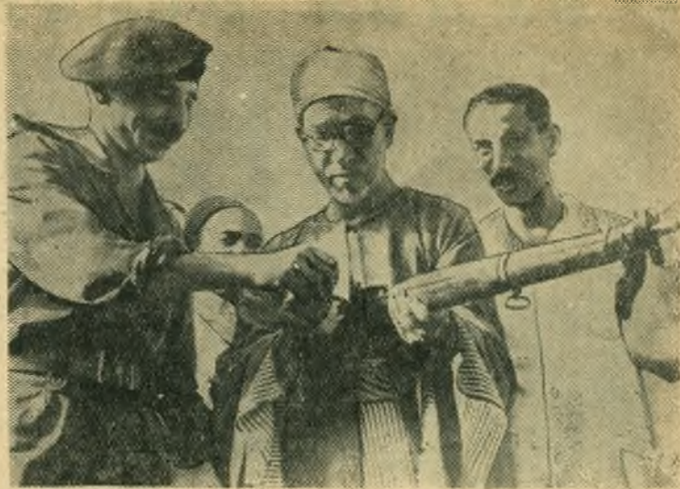
В Египте создается армия национального освобождения. В ее состав войдут Национальная гвардия Египта, молодежные отряды Организации освобождения и добровольцы.