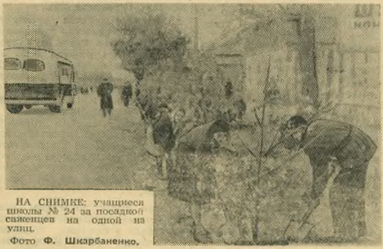
НА СНИМКЕ: учащиеся школы № 24 за посадкой саженцев на одной из улиц.