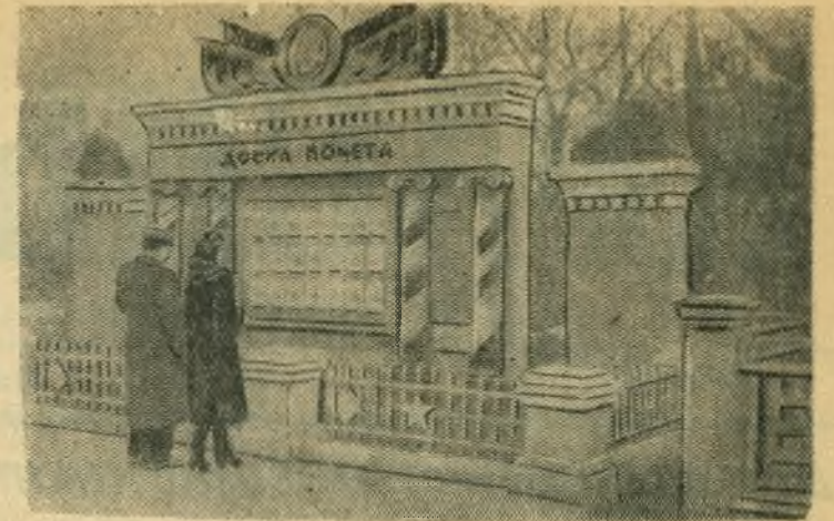
НА СНИМКЕ: Доска Почета, на которую занесены передовики социалистического соревнования станции Сызрань.

В обстановке могучего политического и трудового подъема празднуют советские люди 39-ю годовщину Великой Октябрьской социалистической революции. Вместе с ними знаменательный праздник торжественно отмечают народы стран социализма, все наши многочисленные друзья за рубежом.