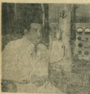
Разрушение металлов вследствие химического или электрического взаимодействия их с внешней средой, называемое коррозией, приводит к снижению или потере металлическими изделиями прочности, пластичности и ряда других полезных технических свойств. Кроме того, коррозия вызывает и прямые потери металлов. Вопросами противокоррозионной защиты металлов, имеющи-

ми важное значение почти для всех отраслей народного хозяйства, занимаются в многочисленных специальных лабораториях, созданных в институтах и на заводах.