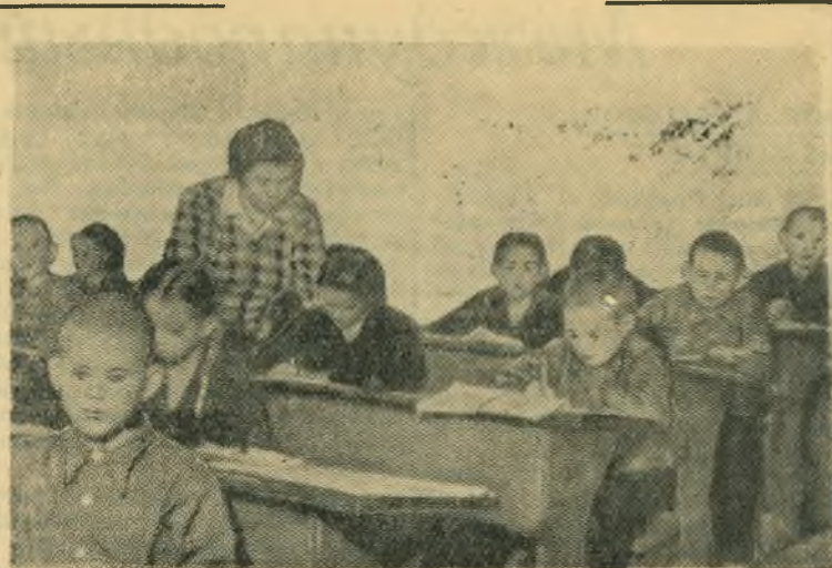
В сызранской школе-интернате. НА СНИМКЕ: учащиеся школы-интерната за подготовкой уроков.