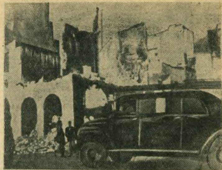
Египет. Порт-Саид. Мечеть, разрушенная в результате варварских бомбардировок, предпринятых англо-французскими агрессорами.