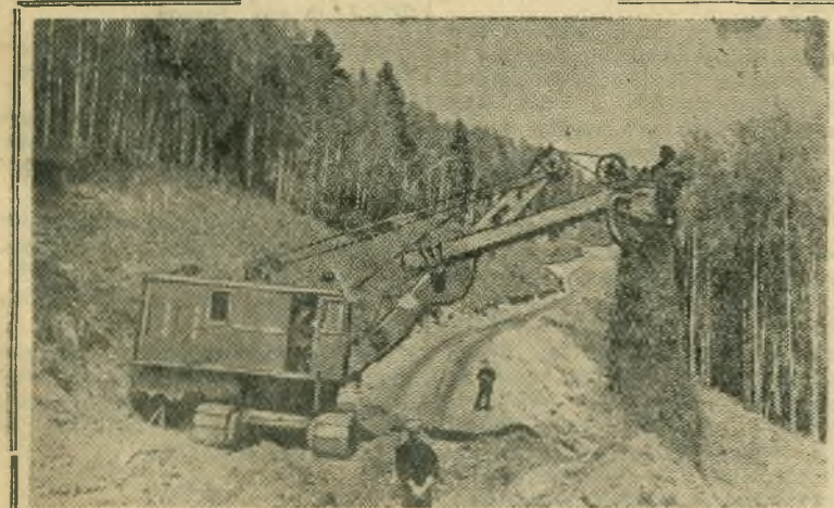
Строители Красноярской ГЭС прокладывают трассу будущего бетонированного шоссе Красноярск—Шумиха. На строительстве применяются мощные бульдозеры и экскаваторы, работают большегрузные автомобили-самосвалы. НА СНИМКЕ: выемка грунта на трассе шоссе в районе Быкова лога.

Исполком горсовета депутатов трудящихся и бюро горкома КПСС отметили неудовлетворительную работу в октябре коллективов гидротурбинного, либери-водочного заводов, заводоуправления № 7, рыбозавода, стеколзавода, обувной фабрики, артелей «Бытовик», «Красный мебельщик».