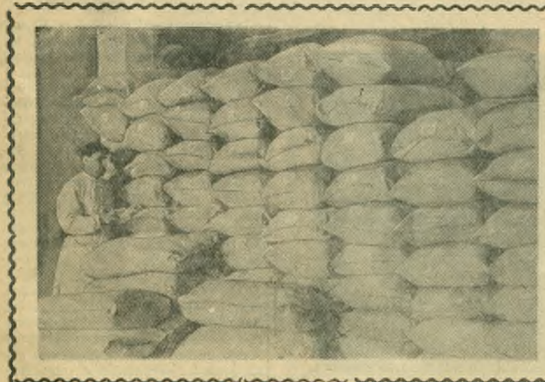
Днепропетровск. Трудящиеся Приднепровья горячо одобрили решение Советского правительства об оказании помощи Венгерской Народной Республике. С большим подъемом трудятся в эти дни коллектив Днепропетровского мельничного комбината. Работники комбината уже отправили трудящимся Венгрии 1.600 тонн первосортной пшеничной муки. Выработка муки для Венгрии продолжается.

Президиум Верховного Совета СССР назначил Первого Заместителя Председателя Совета Министров СССР тов. Молотова Вячеслава Михайловича Министром государственного контроля СССР, освободив в связи с этим от обязанностей Министра государственного контроля СССР тов. Жаворонкова В. Г.